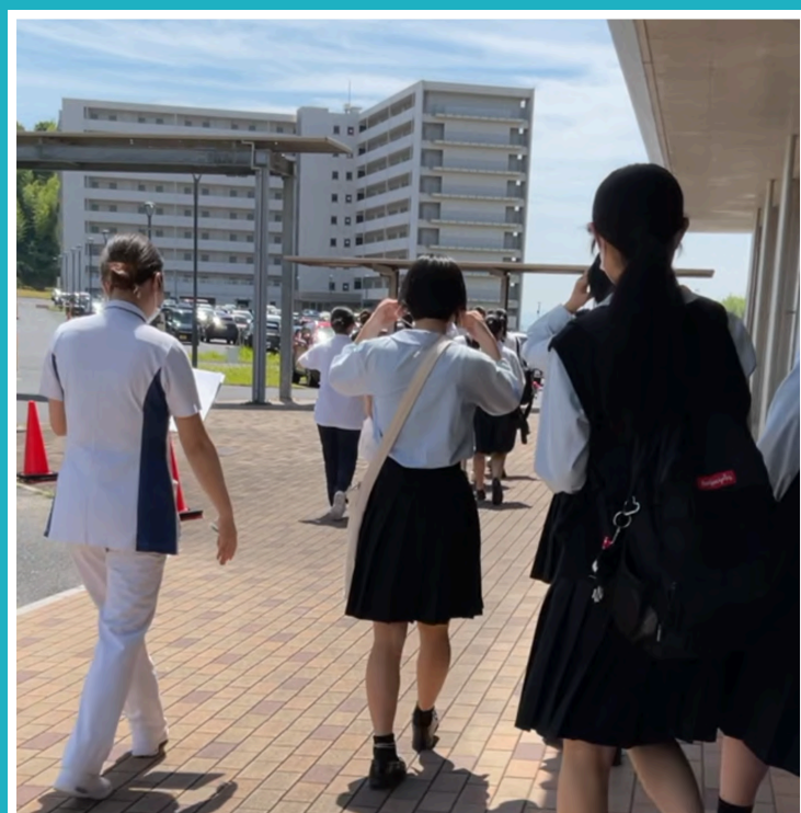
実習施設の見学 「働く場を知ろう」