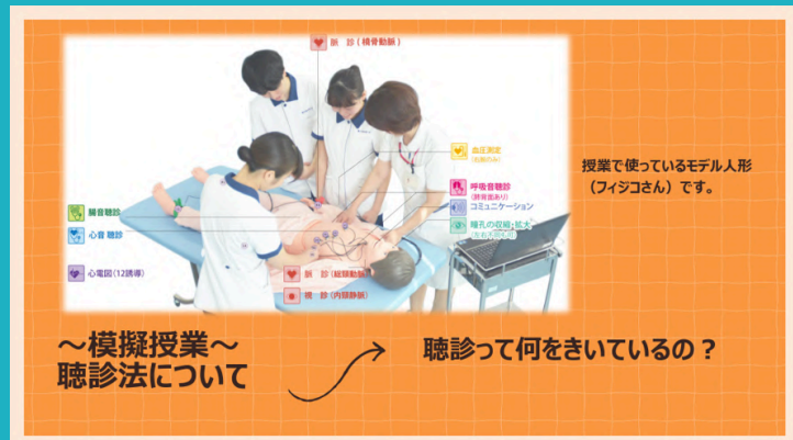
～模擬授業～ 聴診法について