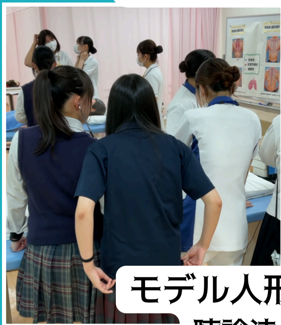
モデル人形を使って、 聴診法にトライ！