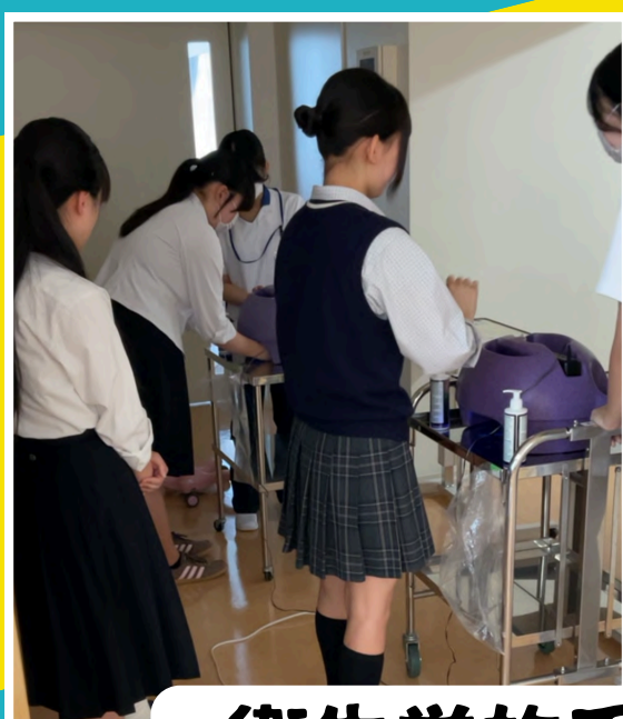
衛生学的手洗い体験！ 綺麗に手を洗えたかな？