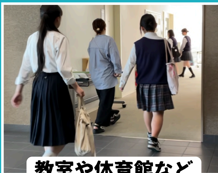
教室や体育館など 学校施設を見学します