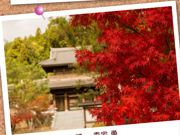
紅... 森宅 勇