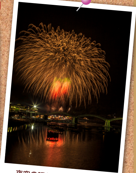
夜空の賑わい... 狩山 睦江