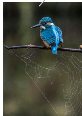
威嚇の目... 狩山 睦江