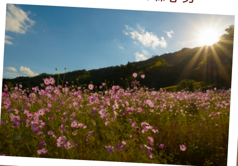
孤高のコスモス... 森宅 勇